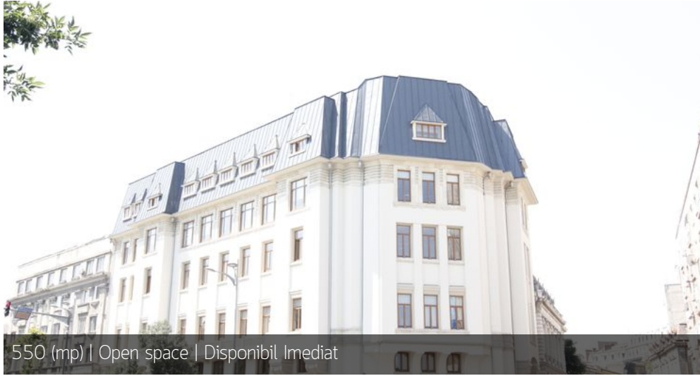
550 (mp) | Open space | Disponibil Imediat

6,500,000 € sau 41,139.24 € / mp + 19% TVA