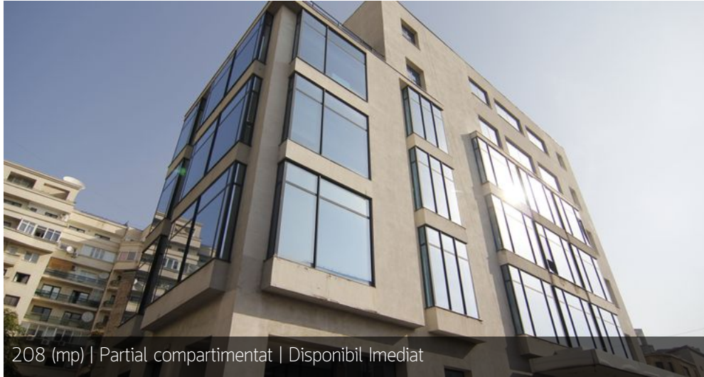
208 (mp) | Partial compartimentat | Disponibil Imediat

10.5 € / luna / mp + 19% TVA 2,800,000 € + 19% TVA