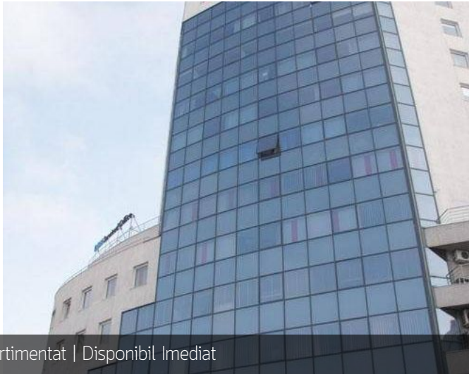
Partial compartimentat | Disponibil Imediat