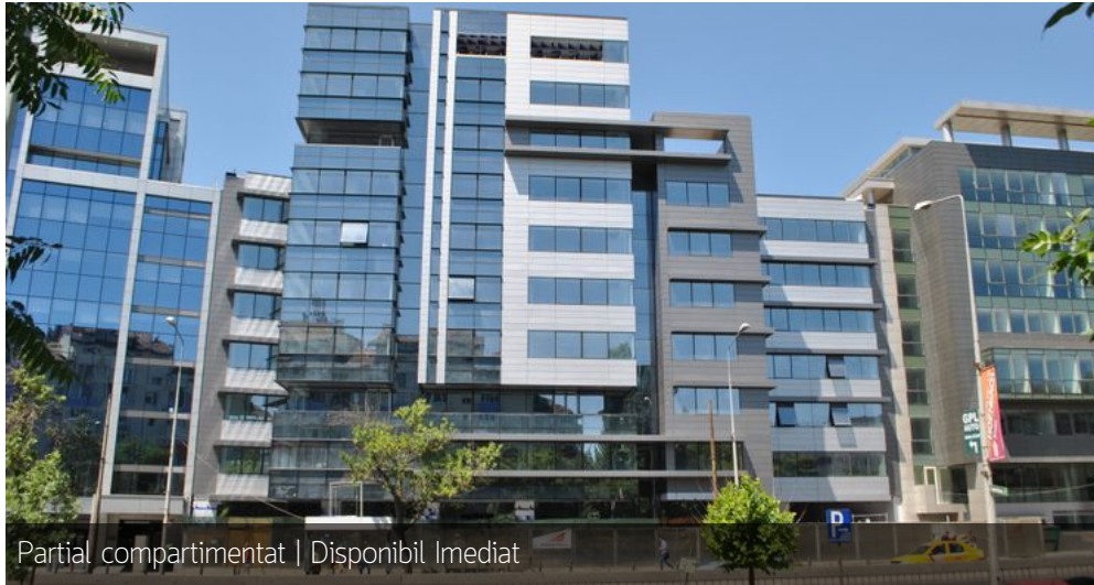
Partial compartimentat | Disponibil Imediat