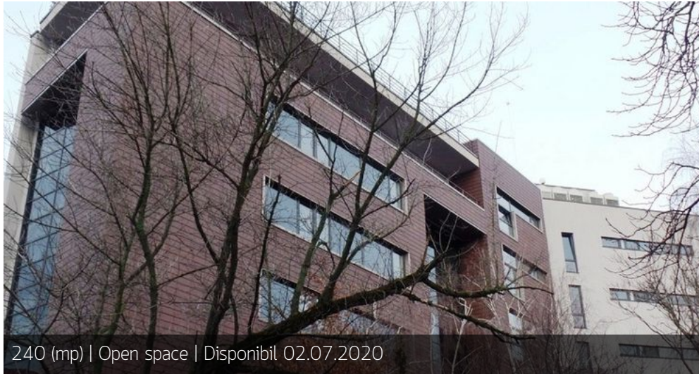
240 (mp) | Open space | Disponibil 02.07.2020