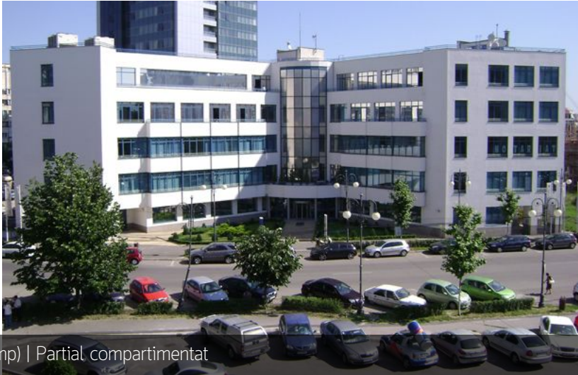
440 (mp) | Partial compartimentat