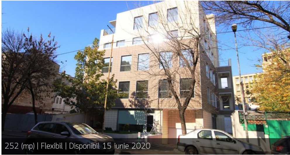
252 (mp) | Flexibil | Disponibil 15 iunie 2020