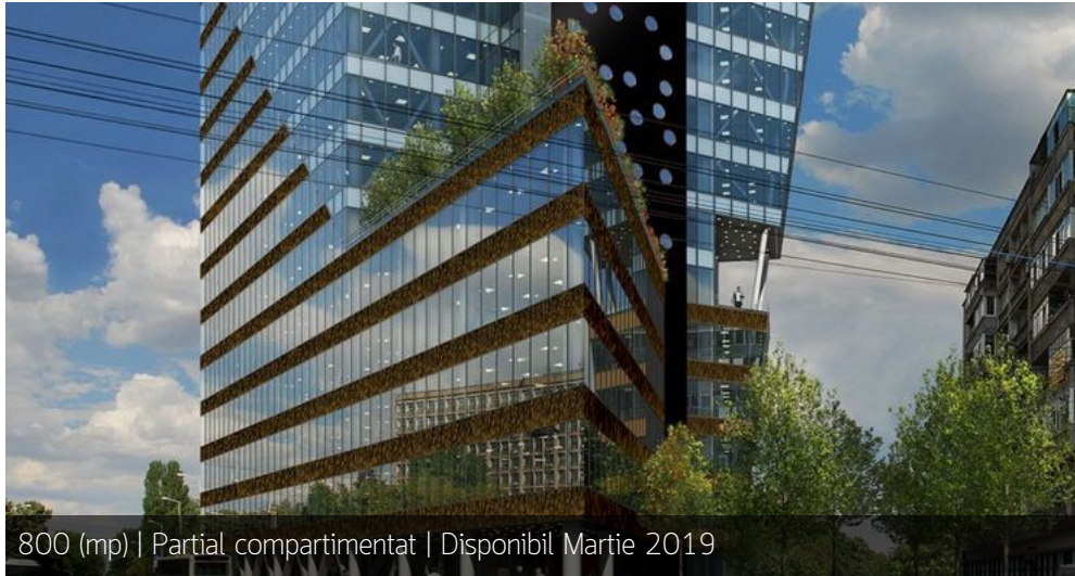
800 (mp) | Partial compartimentat | Disponibil Martie 2019