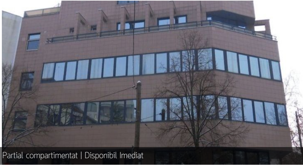
Partial compartimentat | Disponibil Imediat