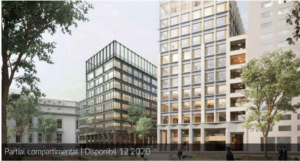
Partial compartimentat | Disponibil 12.2020