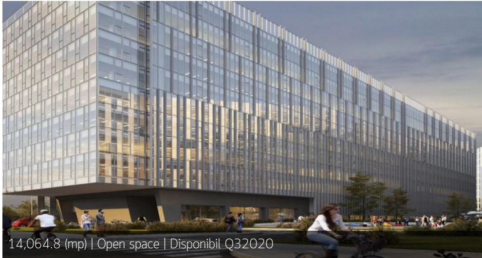
14,064.8 (mp) | Open space | Disponibil Q32020